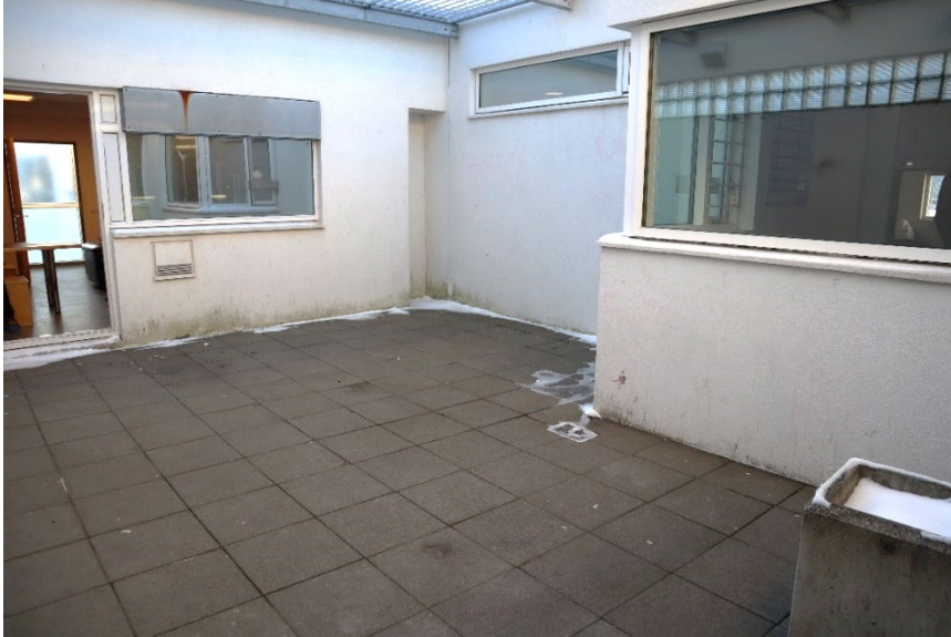
Myndir 7 og 8